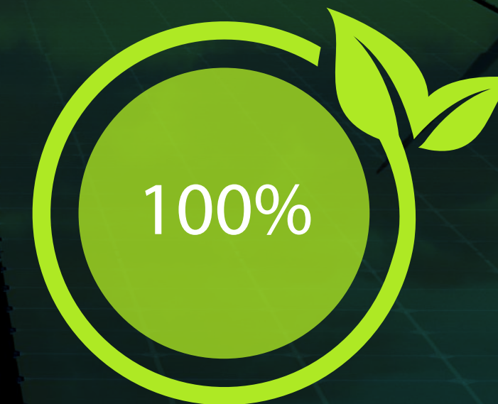
Mix energetico Union Energia