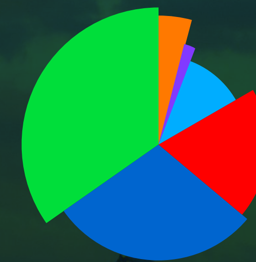
Mix energetico nazionale

Ogni anno Union Energia mette a disposizione la certificazione (G.O.) delle fonti utilizzate per garantirti la provenienza dell'energia utilizzata solo da fonti rinnovabili.